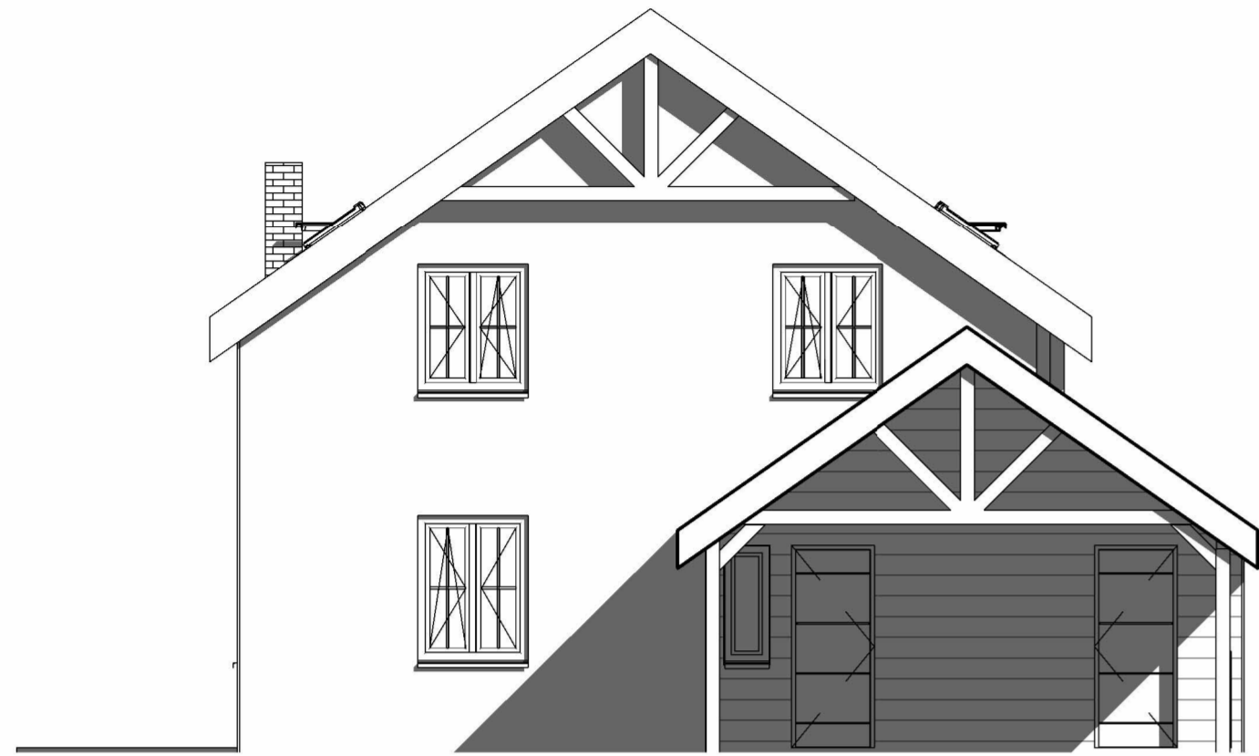
1 Elewacja front . 1 : 75