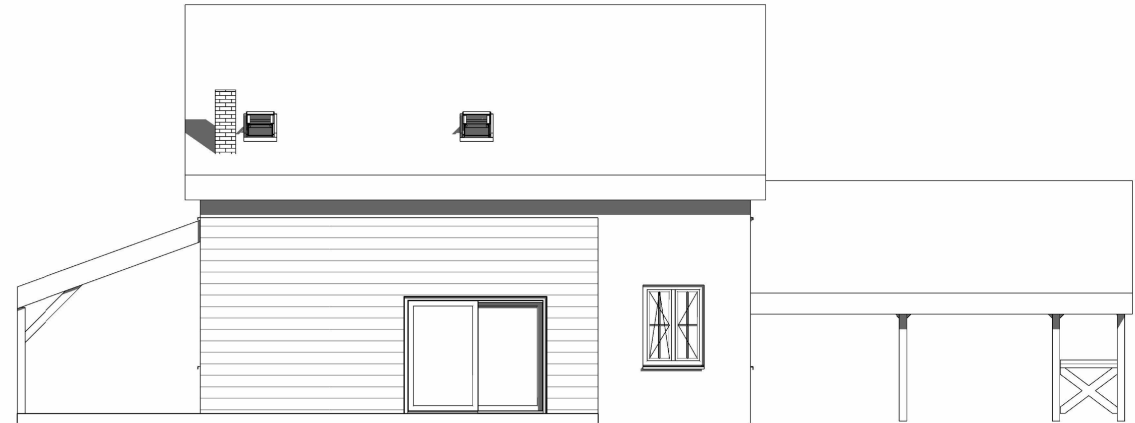
2 Elewacja lewa . 1 : 75